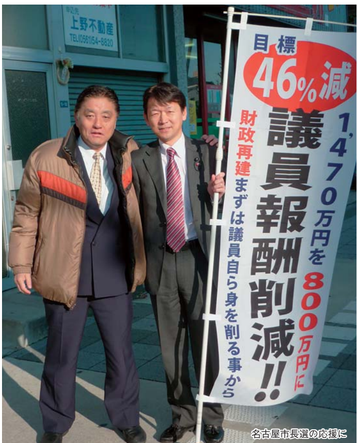
名古屋市長選の応援に

千葉県議会議員は報酬1470万円と政務調査費420万円を頂きます。国の借金は900兆円を超えました。これから社会保障が毎年1兆円ずつ増額になります。その予算を捻出するために、財政削減か増税しかありません。この状況を少しでも改善するために、まずはこの財政を決めてきた議員自ら身を削る事から始め、公開されている政務調査費を削減し、議員活動に必要であれば、公開されている政務調査費を活用すべきと考えます。議員95人の総意にするのは大変かもしれませんが努力します。