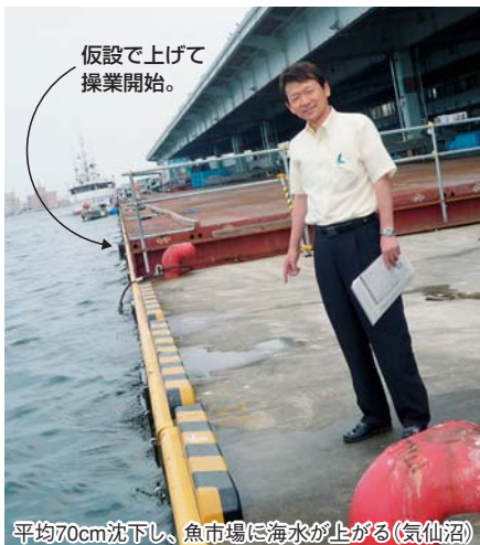
平均70cm沈下し、魚市場に海水が上がる(気仙沼)

津波そして火災が発生し、全体の地盤が平均70cm沈下してしまいました。市長は「震災がなかったとしても人口減少が進んでいた。雇用の場が無くなったらもっと大変になる」と話されておりました。皆で支援をして行きましょう。