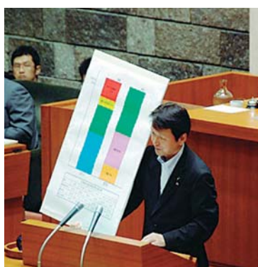
国の財政支出割合のボード