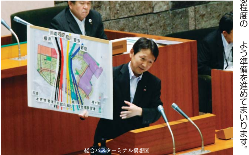
総合バスターミナル構想図

は、800円化によっていかにこの地域の発展が見えたかにかかっている。そして恒久化となれば県負担の15億円がなくなり、また土地の値上がりがあれば、区画整理の事業費の市県負担分89億円の低減にも繋がる。そのための総合バスターミナル化を早期に進めて頂きたい。 渋滞緩和ほぼ成功 三井アウトレット開店